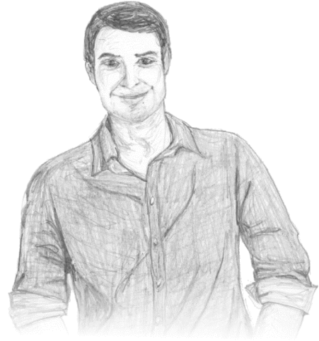
Cizim: Amy Ohler

"Duam şu ki, sevginiz, bilgi ve her tür sezgiyle durmadan artsın. Öyle ki, üstün değerleri ayırt edebilesiniz ve böylece Tanrı'nın yüceltilip övülmesi için İsa Mesih aracılığıyla gelen doğruluk meyvesiyle dolarak Mesih'in gününde saf ve kusursuz olasınız." (Filipililer 1:9-11)