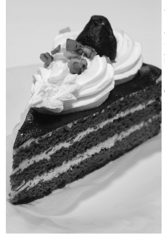
Tarifini vermeye hazır olmalıyız!

Yukarıdaki yemek tarifi örneğinde olduğu gibi, hem lezzet sunmalı hem de insanların o lezzete kavuşabilmeleri için gereken bilgileri vermeliyiz. Tanıklık ve Müjde'nin esasları konularıyla ilgilenirsek, o zaman yanıt vermeye hazır oluruz.