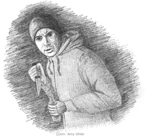
Çizim: Amy Ohler

Peki, bu gördükleriniz sizde nasıl bir izlenim bırakır?