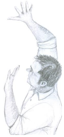
Çizim: Amy Ohler