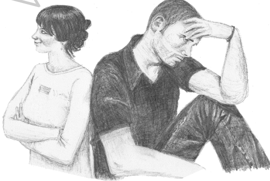
Çizim: Amy Ohler

Kimleri sevmeliyiz? Tek kelimeyle, herkesi. Özellikle Rab'de olan kardeşlerimizi sevmeliyiz. Nasıl sevmeliyiz? Tek bir ölçümüz var: Tanrı gibi sevmeliyiz. İnsanların kusurlu ve yozlaşan sevgi anlayışına kapılmamalıyız. Neden sevmeliyiz? Bu "bir kuş neden uçmalı?" gibi bir soruya benzer. Yeni doğuşla birlikte Tanrı'dan gelen yeni bir doğaya sahip olduk. Bu doğa sevmemizi gerektirir. Sevgi bizi dünyadaki insanlardan ayırır. Sevgi imanlının